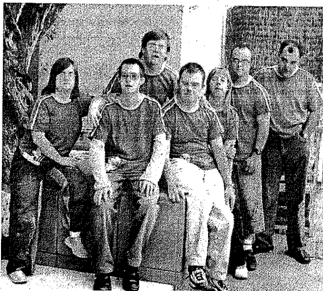
En este grupo hay dos chicos de Salou, que participan en deportes paralímpicos.